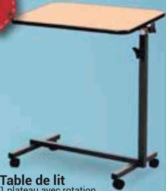
Table de lit 1 plateau avec rotation. Simple et pratique avec roulettes. Dim. : 40 x 60 cm. Dont 0,82 € d'éco-participation.